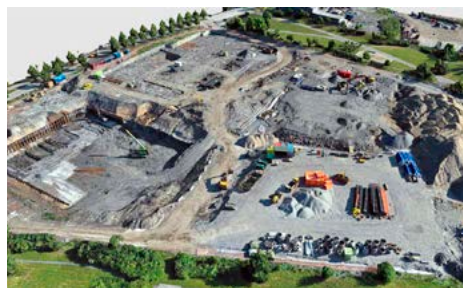
OKSENØYA SENTER: Byggeplassen sett fra luften i juni.

– Hit skal barn, unge og voksne kunne gå, sykle og ta kollektiv til og fra. Vi legger opp til mange sykkelparkeringer og få bilparkeringer, sier Fagerhaug.