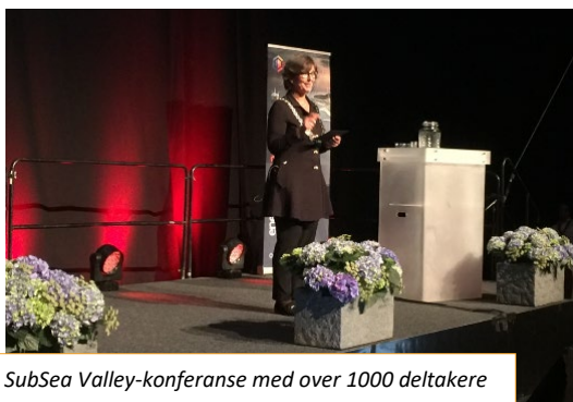
Årlig SubSea Valley-konferanse med over 1000 deltagere fra inn- og utland.

Ordføreren og øvrig politisk ledelse får bistand av sekretariatet til utarbeidelse av presentasjoner, tekster til media og taleskriving. I tillegg planlegger, forbereder og bistår ordførerens kontor ved gjennomføring av representasjonsoppgaver for politisk ledelse.