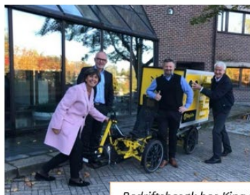
Bedriftsbesøk hos King Coffee.