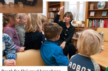
Besøk fra Sleiverud barnehage.