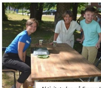
Aktivitetsdag på Emma Hjorth.