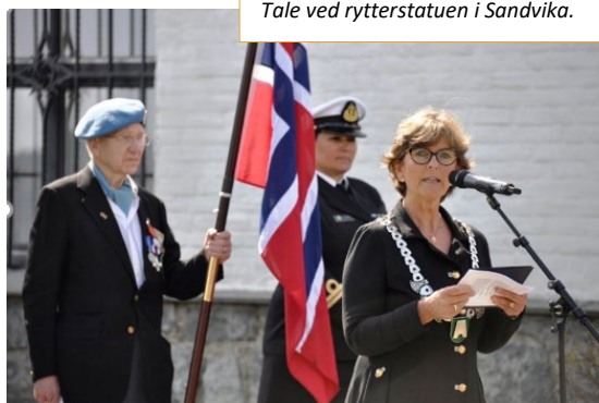
Tale ved rytterstatuen i Sandvika.