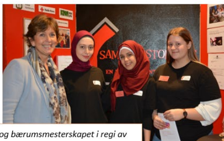
Asker og bærumsmesterskapet i regi av Ungt Entreprenørskap.