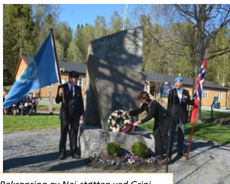
Bekransing av Nei-støtten ved Grini.

Hver 8. mai bekranser og holder ordføreren taler følgende steder; Tanum kirke, Rytterstatuen, Tronstad-monumentet og ved Nei-støtten på Grini.