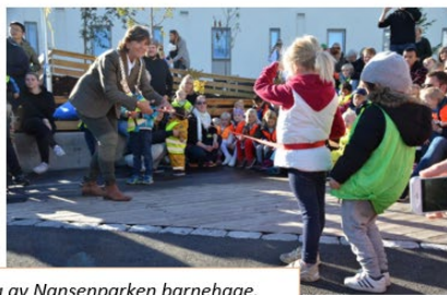
Åpning av Nansenparken barnehage.