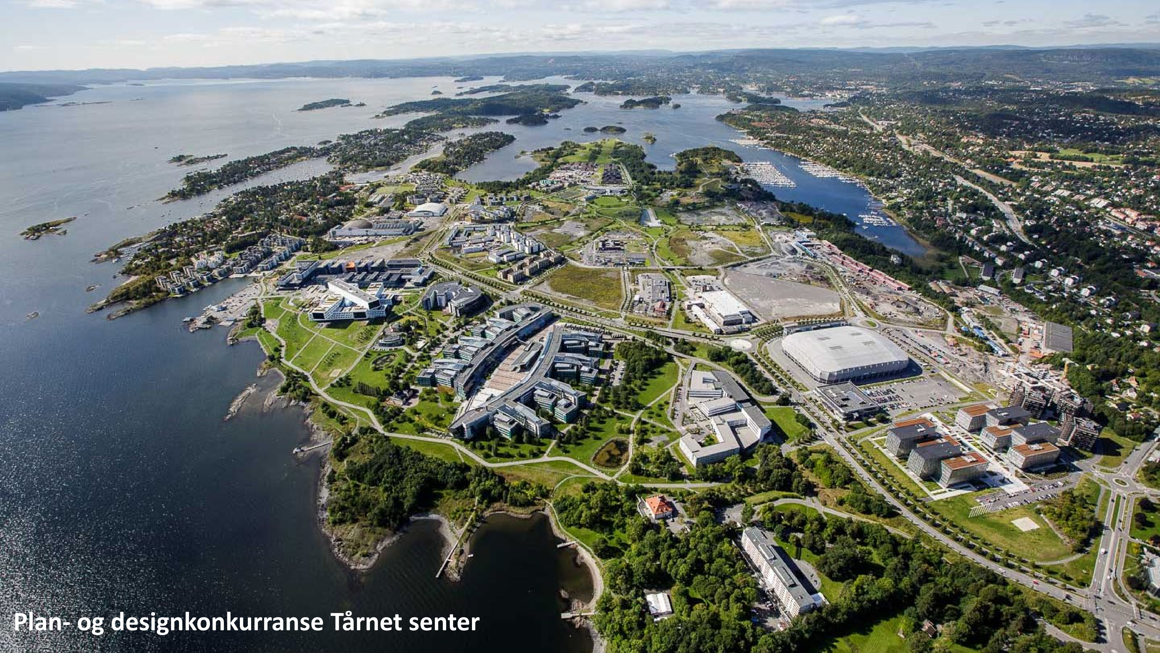
Plan- og designkonkurranse Tårnet senter