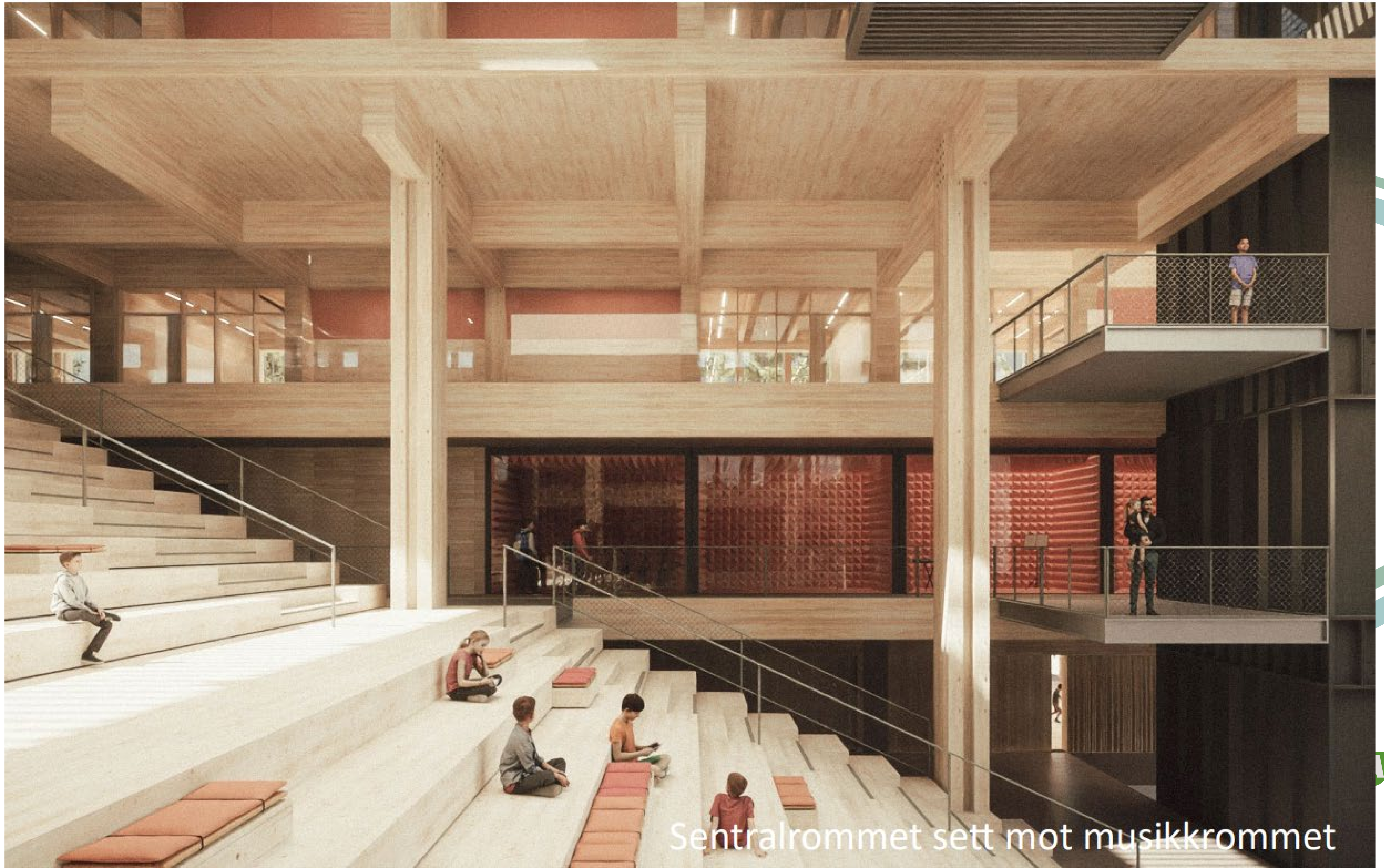
Sentralrommet sett mot musikkrommet