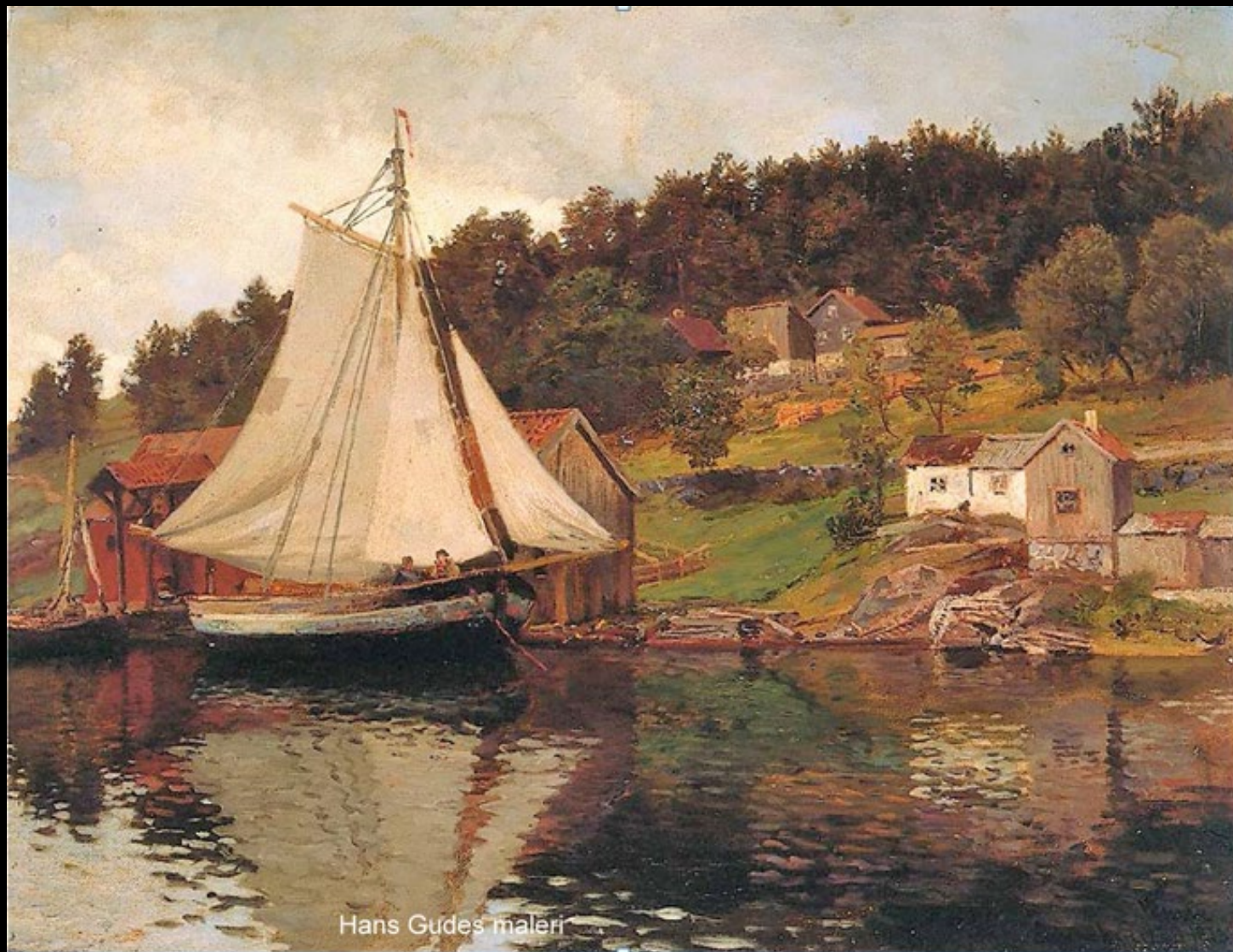
Hans Gudes maleri