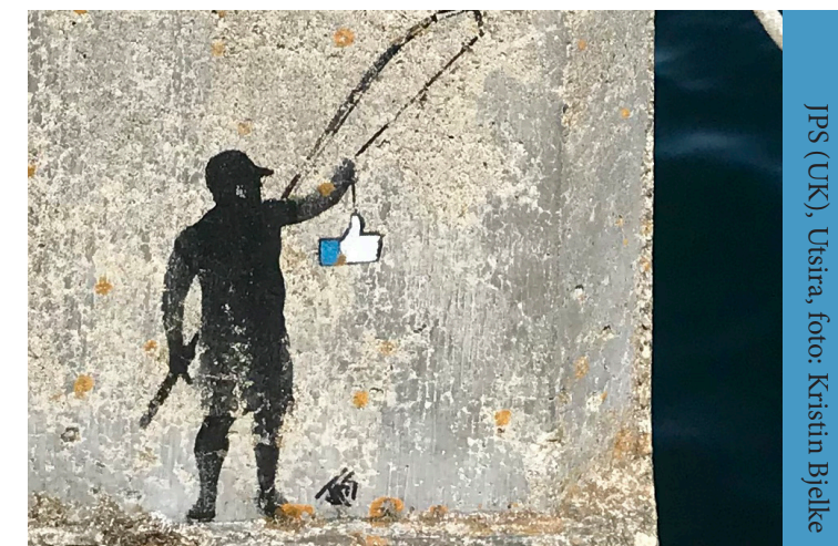
JPS (UK), Utsira, foto: Kristin Bjelke

historien; Bærumssamlingen består av ca. 12 000 fotografier fra Bærum og over 10 000 av dem er digitalisert. Bildene er samlet inn fra 1960-tallet og fremover. Bilder av nyere dato er det mindre av og det jobbes aktivt for at kommende generasjoner også kan få et inntrykk av Bærum etter år 2000. Alle kan laste opp bilder til Bærumssamlingen. Ved å fremme kanalen i forbindelse med dette arbeidet, er det en mulighet for at plattformen etter hvert også kan formidle gatekunst og graffitiens historie i Bærum.