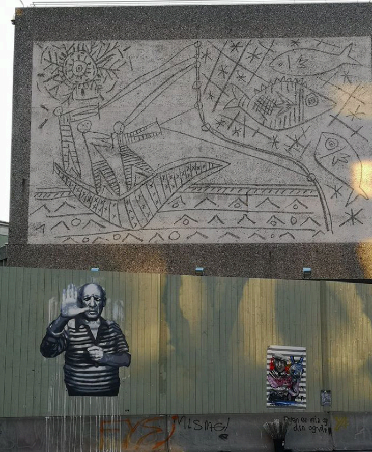
AFK (NO), Oslo 2020

På tross av disse forskjellene blir begge modeller skapt i et samspill med øvrige elementer i byen. Selv om interaksjonen er vesentlig ulik, utforsker begge en mening med det offentlige rom og har den egenskap at de fungerer som verktøy i å skape interessante steder i et byrom.