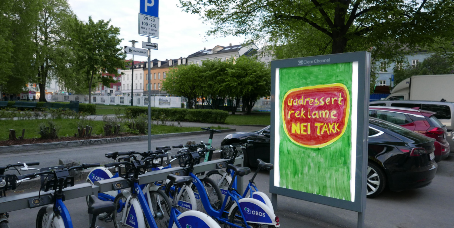
Subvertising Norway, Oslo 2019