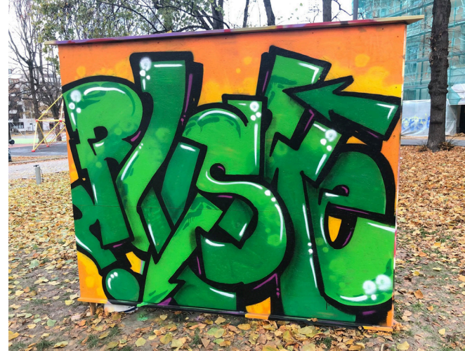
Frivegger i Bydel St. Hanshaugen i Oslo

Ofte et større maleri som utføres på en vegg. Denne kan byttes ut etter et par år eller ikke i det hele tatt.