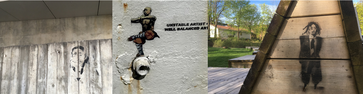
Fra venstre: Ukjent, Sandvika, / JPS (UK), Utsira, / Ukjent, Sandvika