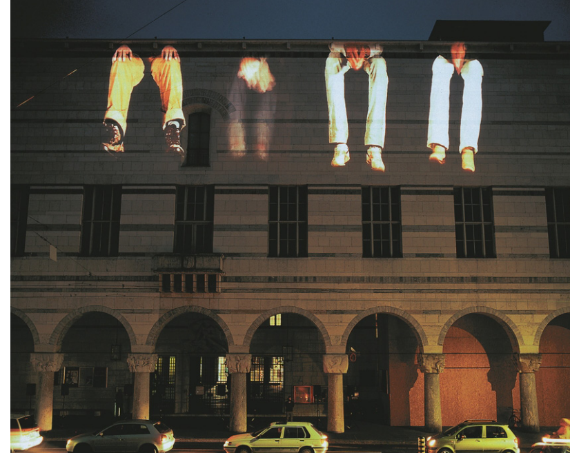
Krzysztof Wodiczko (PL) Sans-papiers , Basel 2006, foto: Krzysztof Wodiczko

Fluxusbevegelsen er en form for konseptkunst som etablerte seg tidlig på 1960-tallet og vedvarte til