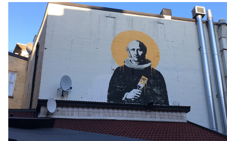
Dolk (NO) Priest , Oslo 2009, foto: Ina Skarpodde

Graffiti og gatekunst skiller seg fra hverandre på en rekke områder. Der graffiti-tradisjonen er bygd opp på et tydelig sett med regler, benytter gatekunsten seg av et større spekter virkemidler. Dette kommer til uttrykk i det som formidles. I graffiti er skrifttegnene det sentrale uttrykket, mens gatekunsten omfavner det figurative motivet. Denne forskjellen handler om kommunikasjon. Graffiti-skriften, som i de fleste tilfeller er vanskelig å forstå for utenforstående, er et uttrykk for en intern kommunikasjon i graffiti-miljøet. I motsetning til dette kommuniserer gatekunstnere med bilder, oftere mer strategisk plassert, og dermed rettet mot et bredere lag av befolkningen. I relasjon til dette opererer gatekunstutøveren mer selvstendig og ikke som en del av større grupperinger (crew), noe som er normalt i graffiti-miljøet.