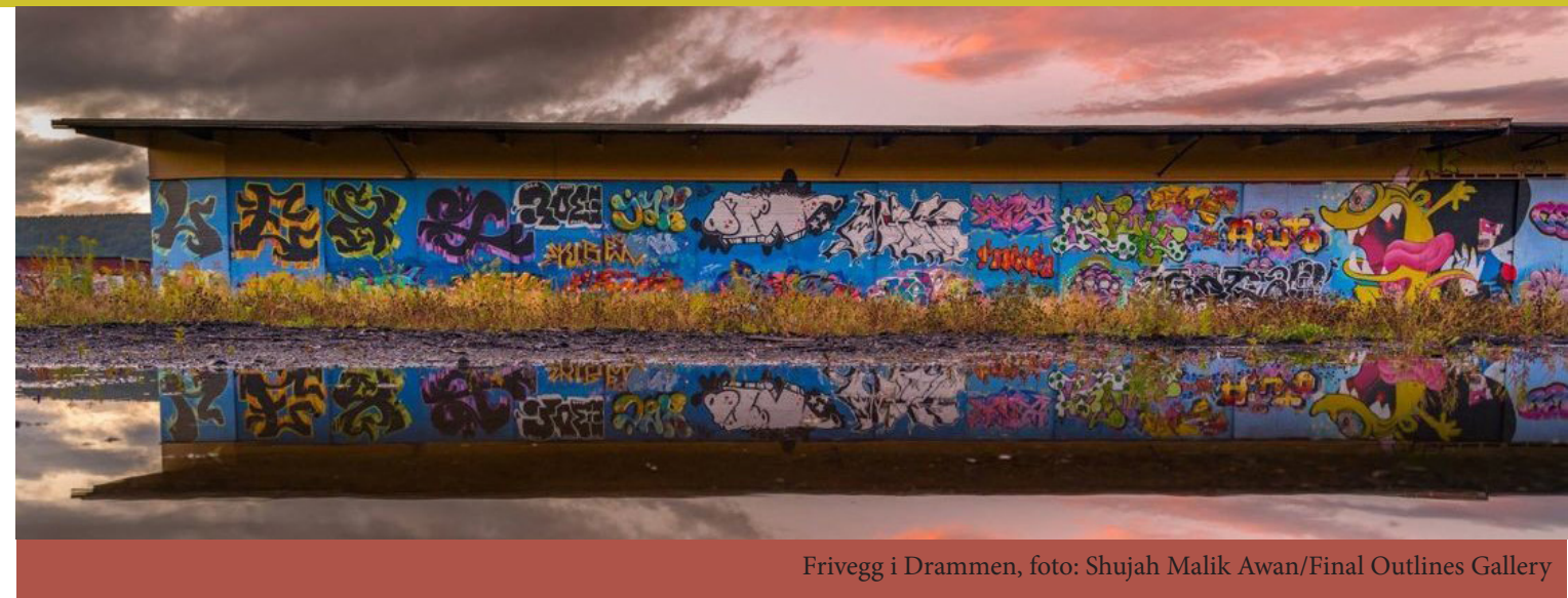
Frivegg i Drammen, foto: Shujah Malik Awan/Final Outlines Gallery

politiske toleranse for graffiti på lovlige vegger har bidratt til en vesentlig kvalitetsøkning i uttrykkene. Et annet resultat av tiltaket er at byens befolkning har fått større aksept og respekt for graffiti som uttrykksform. Tiltaket utvides i handlingsplanen for 2011-2018 Graffiti og gatekunst i kulturbyen Bergen . Hver bydel skal få disponere minst en lavterskel, selvstyrt, lovlig vegg og veggene skal etableres i tilknytning til kommunalt finansierte- eller kommunalt eide ungdomshus og kulturarenaer.