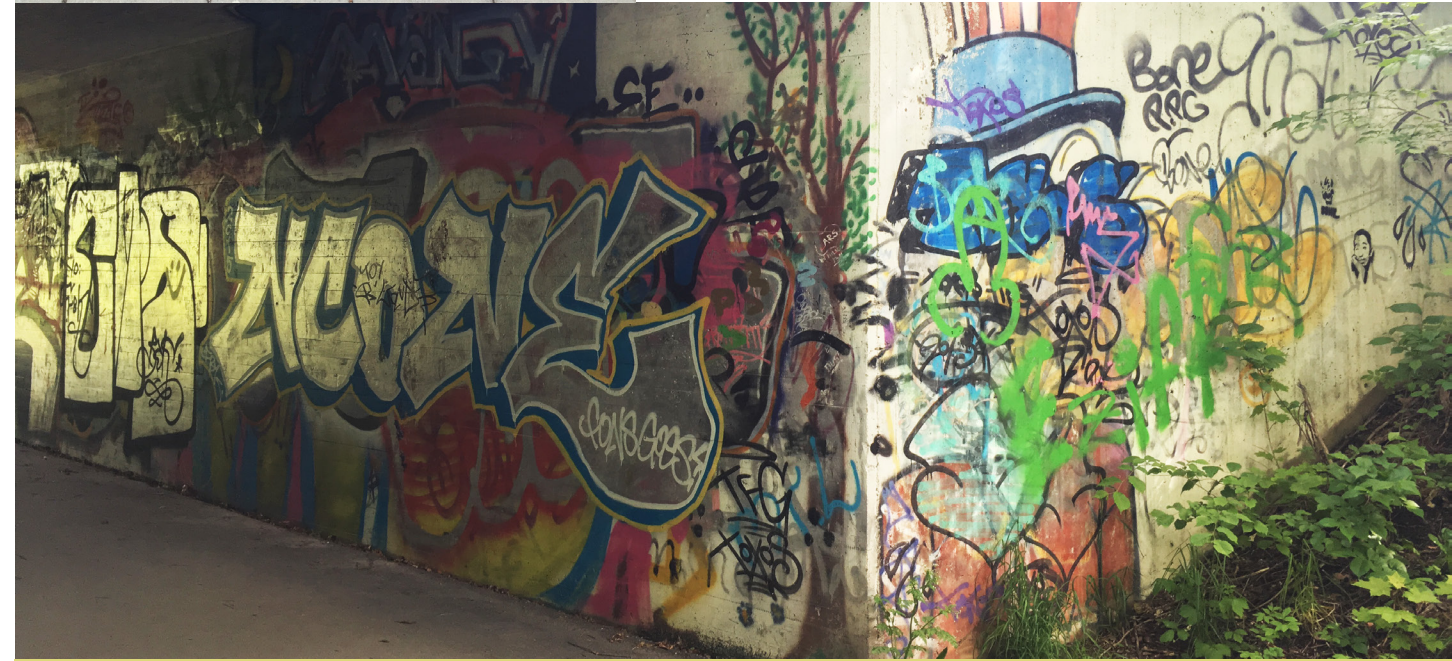
Undergang i Bærum

I 2014 arrangerte Bærum kunstforening en storstilt street art-utstilling, med verk både inne i galleriet og ute i byrommet. Utstillingen presenterte arbeider av noen få lokale, og ellers nasjonale og internasjonale aktører, og ble Sandvikas og Bærums første møte med regulert gatekunst.