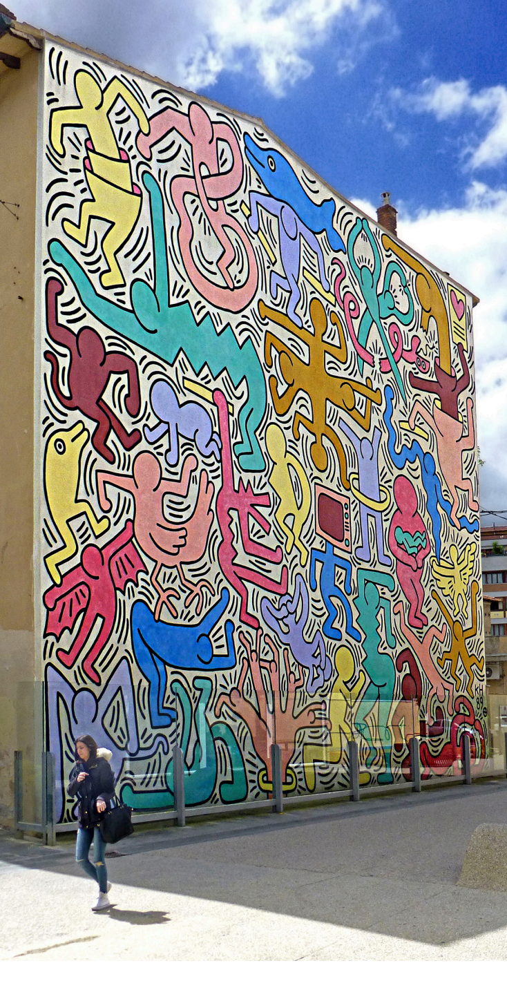
Keith Haring (USA), Pisa 1989, foto: Pom/flickr