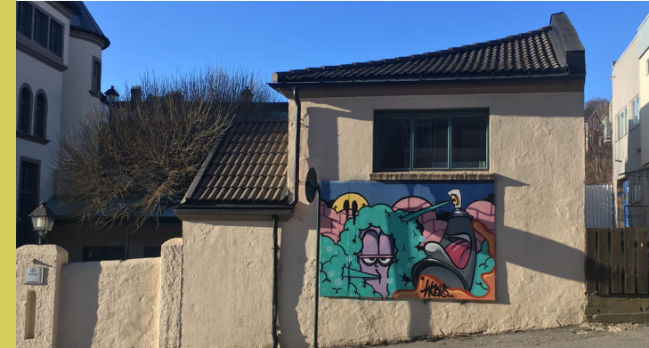
WOBLE (NO), Larvik

På sikt kan man vurdere å plassere ut flere løse-vegger samt vurdere eksisterende murvegger som frivegger.