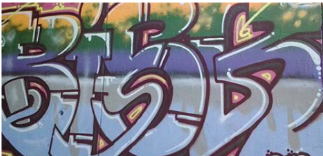
Anonym, Oslo 2007-2018