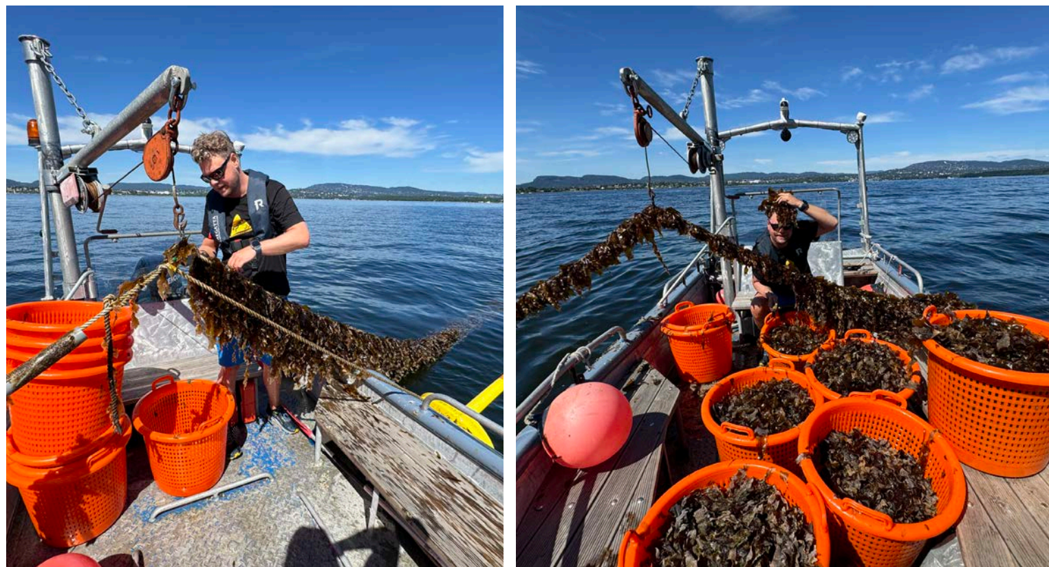
Den ideelle miljøorganisasjonen Marinreparatørene startet Norges første marine nyttehage på Nesodden i januar i år. Nå ønsker de at den neste skal ligge i Bærum.