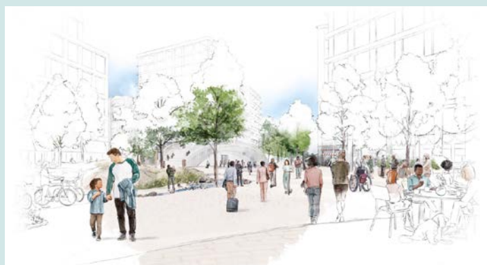
Illustrasjon av Fornebu sør. Illustrasjon: Esra Røise

Fornebu sør - planprogram med byplangrep ble vedtatt i kommunestyret 19. juni.