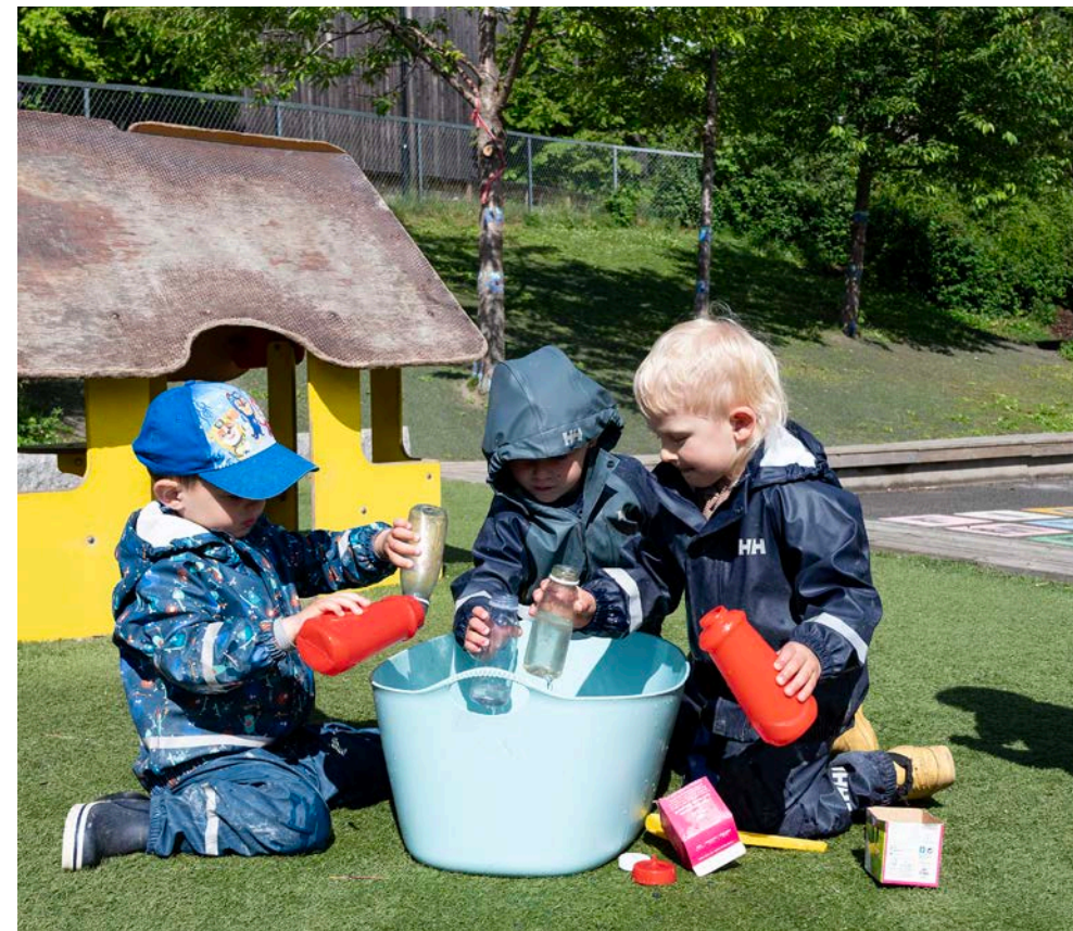
– Etter hvert er planen mer gjenbruk og åpne materialer ute også, forteller Rustad.

– Når vi skal overlate rommet til en ny gruppe sorterer vi tingene. Da kan barna også være med og bestemme hvordan det skal sorteres før en ny gruppe kommer, sier Rustad.