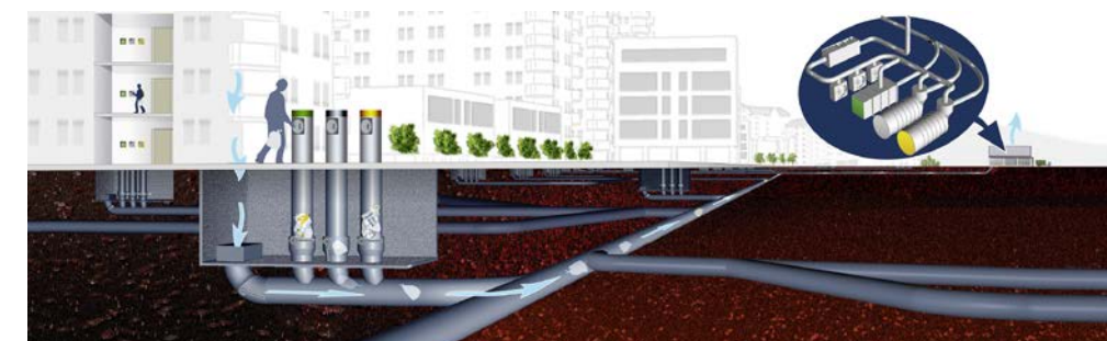
Avfallssug innebærer at avfallet suges i rør under bakken til en terminal som er plassert et annet sted. Snart kommer avfallssug også til Sandvika. Illustrasjon: Knut Johansen

– Det har mye å si for sikkerheten, særlig for barna, sier hun.