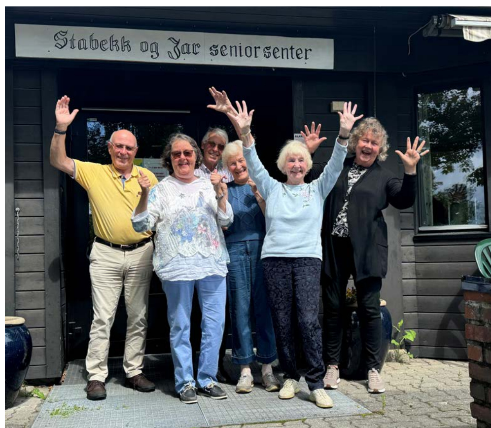
Bærum kommune har gjennomført fokusgrupper på nesten alle seniorsentrene, i tillegg til brukerundersøkelse og ideverksteder. Dette er gruppen fra Stabekk og Jar seniorsenter.

Med prosjektet «Fremtidens senioraktiviteter i et aldersvennlig Bærum» er målet å teste ut nye løsninger basert på innbyggernes behov.