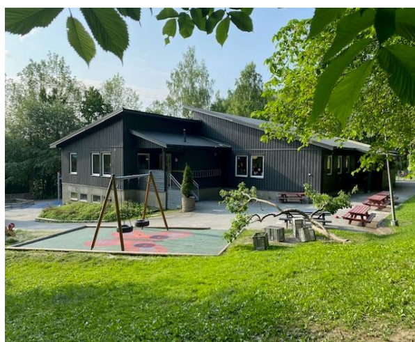
Avdeling Vestre Jong